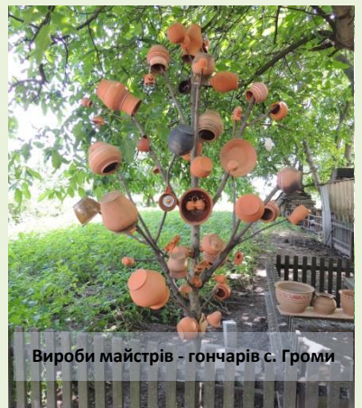
Вироби майстрів - гончарів с. Громи