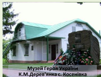
Музей Героя України К.М.Дерев'янка с. Косенівка