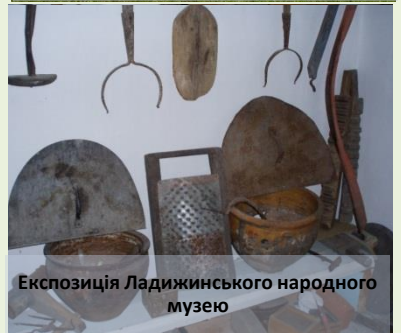
Експозиція Ладжинського народного музею