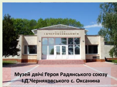
Музей двічі Героя Радянського союзу І.Д.Черняховського с. Оксанина