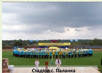
Стадіон с. Паланка