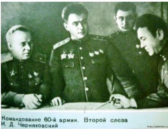
Командование 60-й армии. Второй слева И. Д. Черняховский

досвіді. Зазвичай рішення і дії командувача фронтом ставили противника у безвихідь.